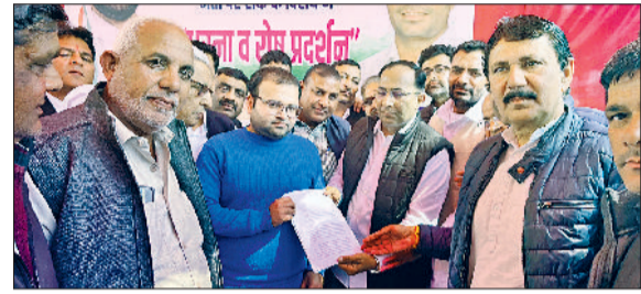
कैथल। तहसीलदार को ज्ञापन सौंपते कांग्रेसी कार्यकर्ता।