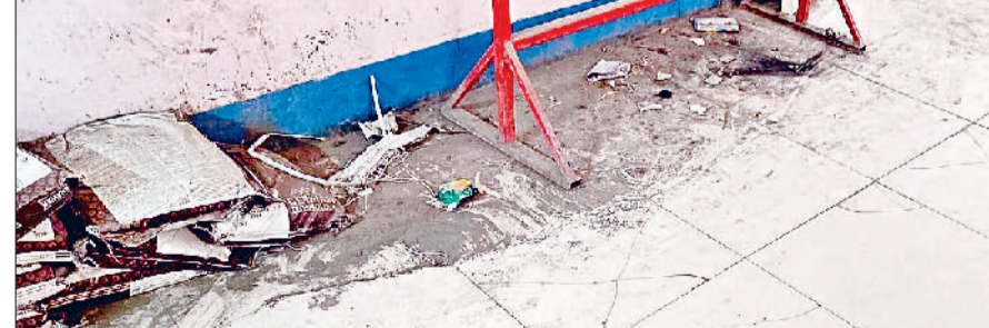
जीद। नागरिक अस्पताल पुरानी बिल्डिंग में शौचालय के पास चटकी टाइलें।

जिला मुख्यालय स्थित नागरिक अस्पताल की पुरानी बिल्डिंग में 14.91 करोड़ से करवाए जा रहे जीर्णोद्धार के कार्य पर लगातार सवालिया निशान लगते रहे हैं। कभी गुणवत्ता को लेकर तो कभी काम सही तरीके से न होने पर आवाज उठाई जाती रही है। पुरानी बिल्डिंग में शौचालय के पास लगाई गई टाइलें अभी से चटक गई हैं। जबकि इन टाइलों को लगाए हुए एक माह भी नहीं हुआ है। यहां जो टाइलें लगाई गई हैं, इन पर चलते