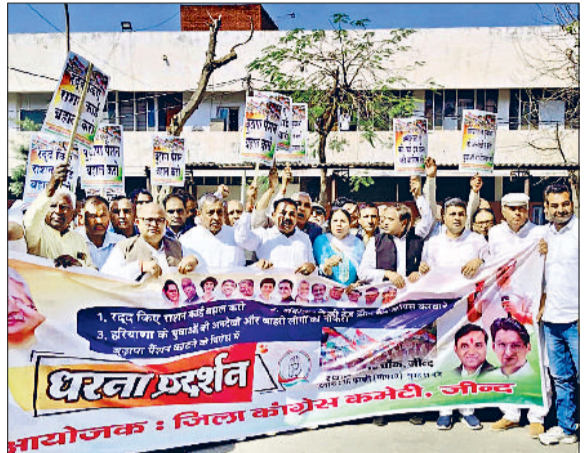
मामों को लेकर प्रदर्शन करते तथा ज्ञापन सौंपते हुए कांग्रेस कार्यकर्ता।