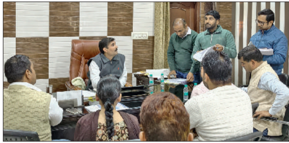
पूंडरी। नगरपालिका में बैठक के दौरान पार्षद व अधिकारी।

रही कि नगर पालिका के कुल 16 पार्षदों में से केवल सात पार्षद बाइस