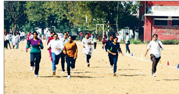
जीद। दौड़ प्रतियोगिता में भाग लेते हुए छात्राएं।

एवं प्रबंधन कौशल से संबंधित फिल्मों का प्रदर्शन विद्यार्थियों के मानसिक तनाव को कम करने तथा उनके व्यक्तित्व विकास में सहायक सिद्ध हो सकता है। परिषद ने सुझाव दिया कि विवि ऑडिटोरियम या किसी उपयुक्त हॉल में नियमित अंतराल पर फिल्म प्रदर्शन की व्यवस्था की जाए।