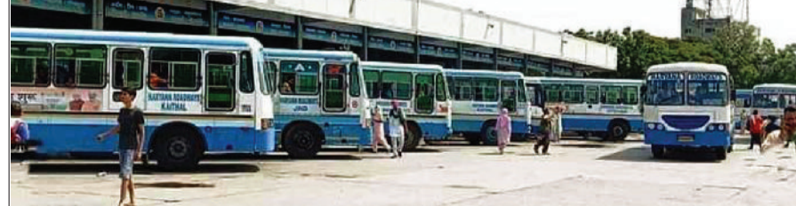
कैथल। डिपो में खड़ी बस।

बजाय स्थानीय रूप से दूसरे डिपो को ट्रांसफर कर दिया गया है। विभाग द्वारा अब इस रूट के संचालन की जिम्मेदारी करनल के असंध सब-डिपो को सौंप दी है। बता दें कि इससे पहले अमृतसर जाने वाली बस सेवा भी कैथल डिपो से हटाई जा चुकी है। लगातार रूट कम होने से डिपो की आय और यात्रियों की सुविधाओं पर असर पड़ेगा।