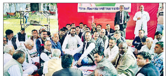
कैथल। लघु सचिवालय में प्रदर्शन करते कांग्रेसी कार्यकर्ता।